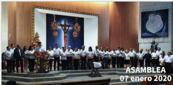
ASAMBLEA 07 enero 2020

Misa de acción de gracias, presentación y envío del Nuevo Secretariado del MEC Período 2020 - 2021, por Monseñor Oswaldo Escobar.